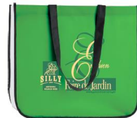
Sac réutilisable « Foire de Jardin »