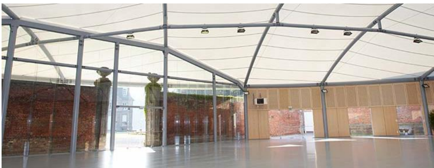
Salle des Acacias