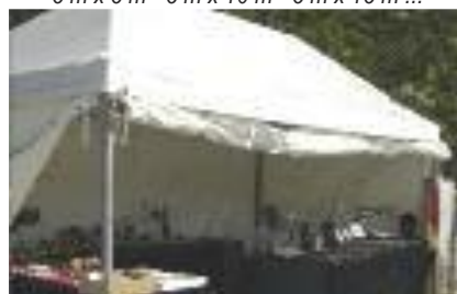
Tentes avec ou sans plancher 5 m x 2,5 m