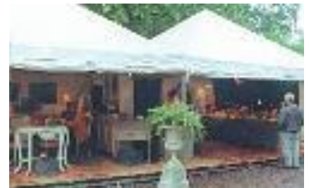
Tenten zonder of met vloer 5 m x 5 m - 5 m x 10 m - 5 m x 15 m ...