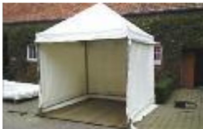
Tenten zonder of met vloer 2,5 m x 2,5 m