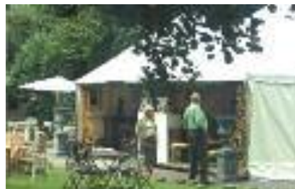
Tenten zonder of met vloer 5 m x 5 m - 5 m x 10 m - 5 m x 15 m ...