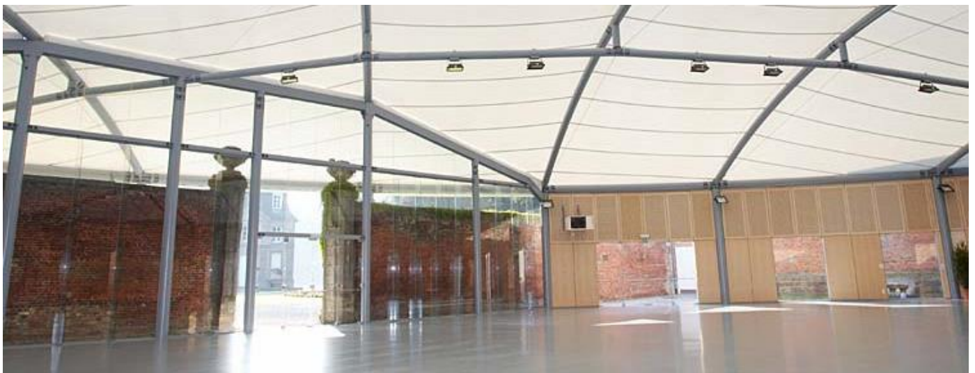
Salle des Acacias