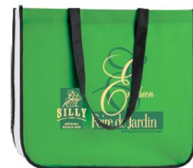
Sac réutilisable « Foire de Jardin »