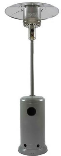
Parasol chauffant au gaz

Une caution de 20,00 € est demandée pour les matériaux en location, elle est restituée dès leur remise.